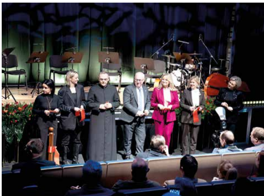
W programie uroczystości było m.in. przecięcie wstęgi

Otwarcie sali widowiskowej to kolejny krok w umacnianiu pozycji Tłuszcza jako ważnego ośrodka kulturalnego w regionie. Jak podkreślano podczas wydarzenia – dziś Tłuszcz stoi nie tylko koleją, ale również kulturą.