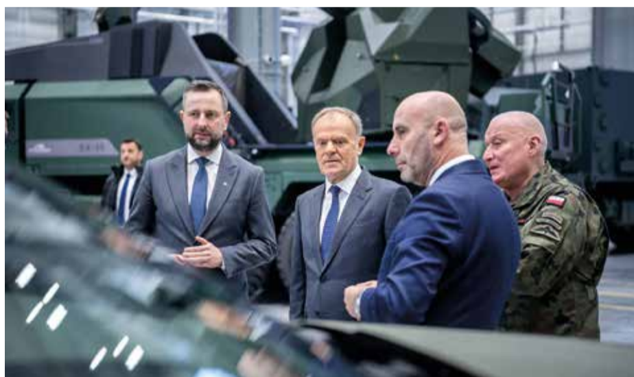
W uroczystości uczestniczył premier Donald Tusk i wicepremier Władysław Kosiniak-Kamysz - Szef MON

W piątek, 30 stycznia, na terenie spółki PIT-RADWAR S.A. w Kobyłce podpisano umowę na dostawę przeciwlotniczych zestawów o kryptonimie SAN – nowoczesnego systemu do zwalczania bezzałogowych statków powietrznych. Inwestycja ma istotne znaczenie dla bezpieczeństwa państwa oraz rozwoju polskiego przemysłu obronnego.