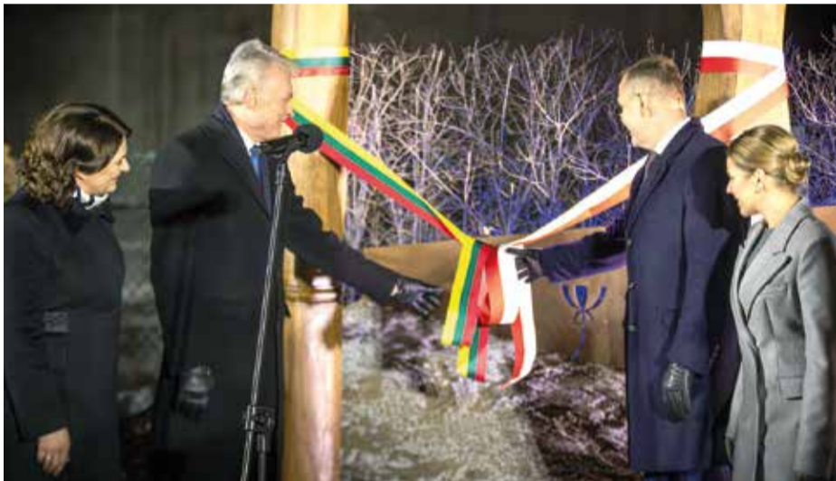
Odsłonięcie kompozycji przez prezydentów Polski i Litwy

Kompozycja została usytuowana przy bramie prowadzącej do klasztoru Sióstr Franciszkanek Rodziny Maryi w Markach, przy ul. Kasztanowej.