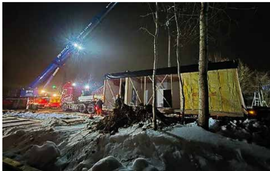
Montowanie pierwszych modułów żłobka

Po zakończeniu inwestycji miasto otrzyma również wsparcie finansowe z Funduszy Europejskich dla Rozwoju Społecznego (FERS) na utrzymanie nowo utworzonych miejsc opieki dla dzieci do lat 3.