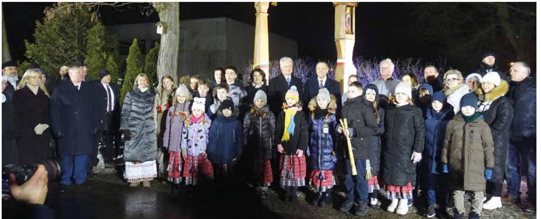
Uczestnicy uroczystości litewskiej Szkoły Podstawowej Żiburys w Sejnach