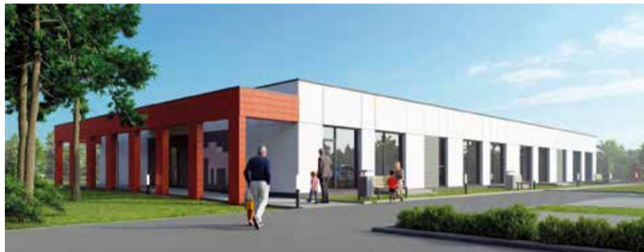
Wizualizacja żłobka gminnego

Żłobek powstaje przy ul. Wileńskiej w Kobyłce, w ramach „Programu rozwoju instytucji opieki nad dziećmi w wieku do lat 3 – Aktywny Maluch 2022–2029”. W obiekcie zaplanowano cztery sale opieki, które zapewnią miejsce dla około 100 dzieci do trzeciego roku życia.