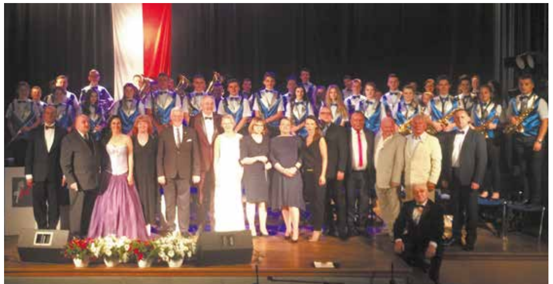
Sanocka Młodzieżowa Orkiestra Dęta Avanti wraz z współtwórcami i organizatorami festiwalu