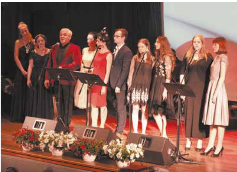
Laureaci konkursu wokalnego oraz soliści