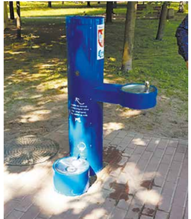
Źródło w Parku Schuberta

Od wielu miesięcy prowadzimy intensywne prace wdrożenia Systemu Informacji Geograficznej (GIS - ang. geographic information system ) - systemu służącego w naszym przypadku do wprowadzania, gromadze-