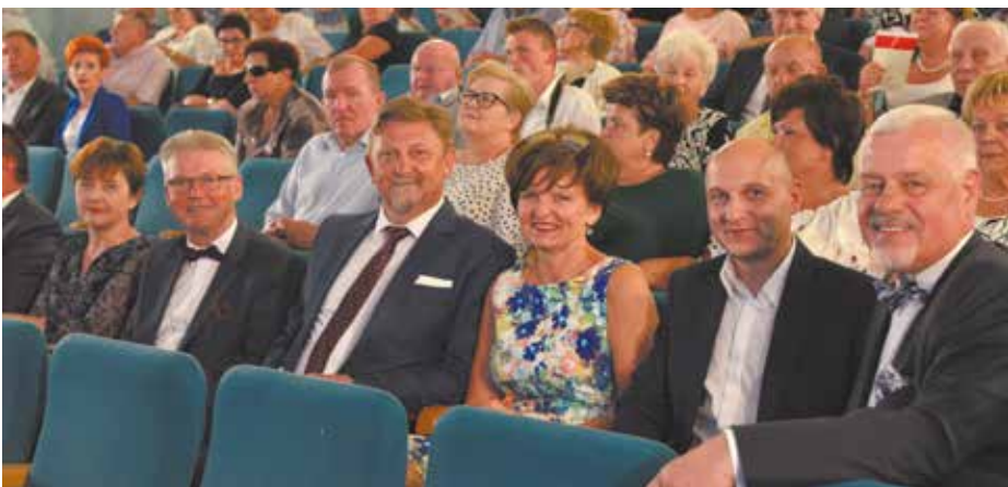
Goście honorowi i festiwalowa publiczność

zrodził się z myślą o Was – kochających pieśni legionowe i pragnących je ocalić od zapomnienia. Duże zainteresowanie wydarzeniem i Wasze ciepłe słowa motywują nas do organizowania kolejnych edycji.