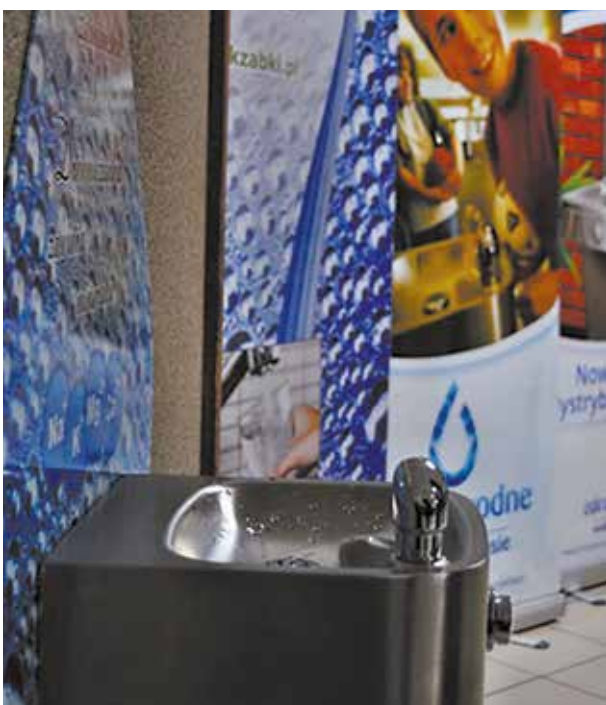
Źródełka w szkołach