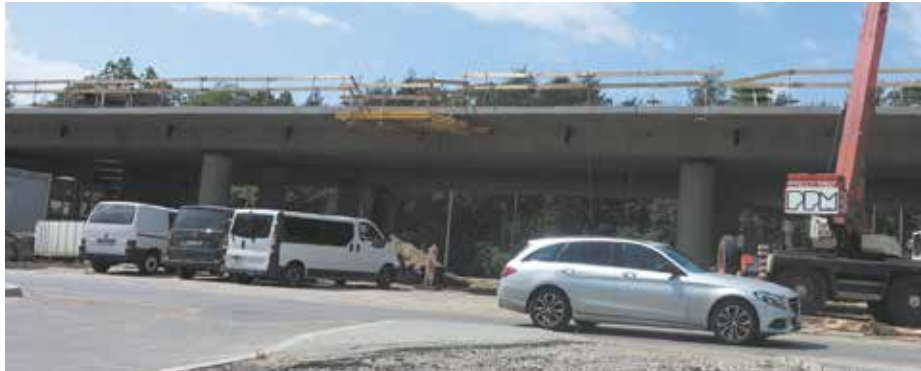
Trwa budowa wiaduktu na skrzyżowaniu z ul. Czwartaków