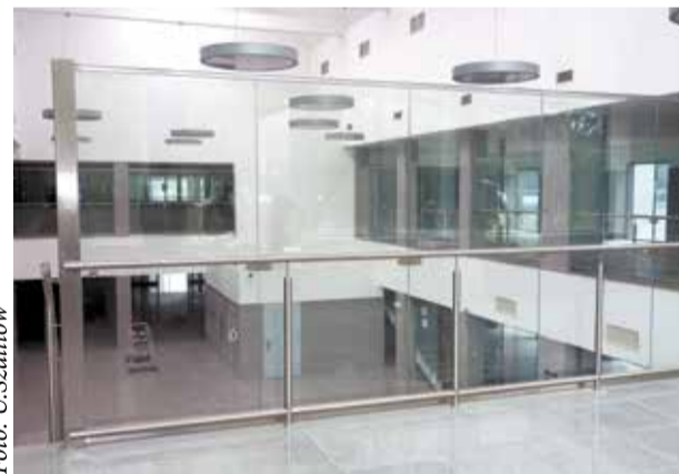
Nowoczesne, przeszklone wnętrza robią wrażenie