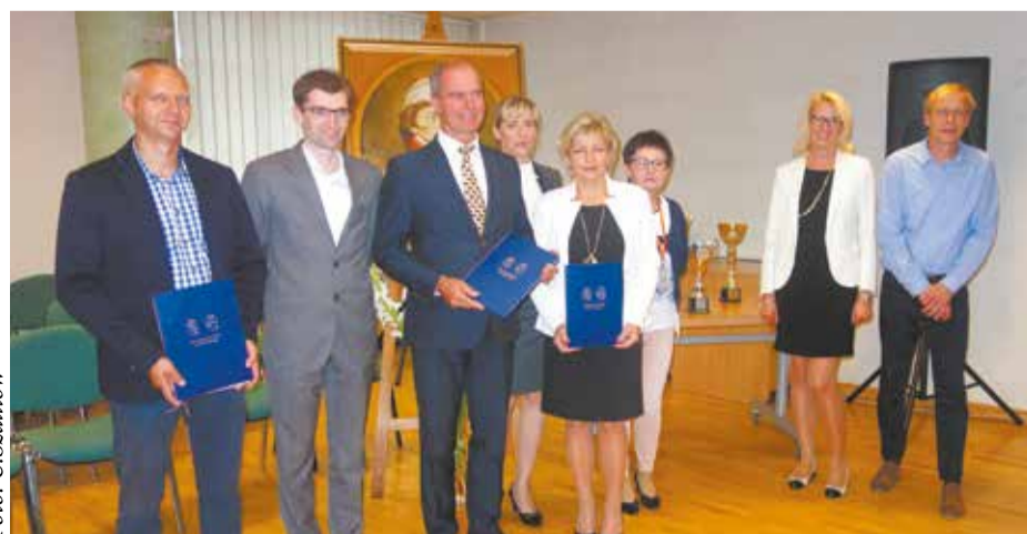
Tę wyjątkową chwilę udokumentowano pamiątkowym zdjęciem

W roku 2016 została opracowana dokumentacja projektowa, której koszt wyniósł 28 290,00 złotych.