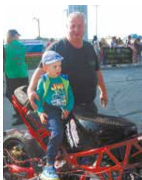
... usiąść na wspaniałym motorze...