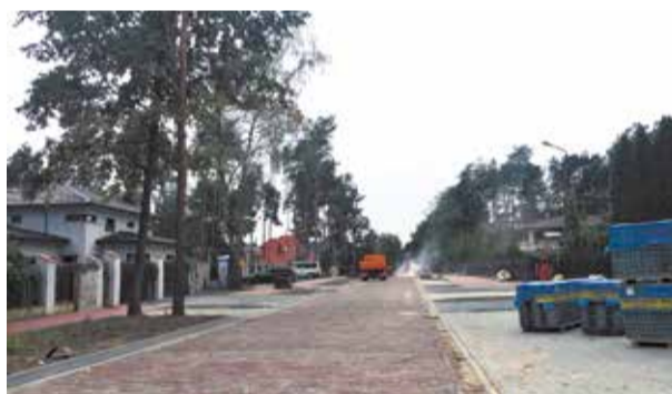
Ul. Lipowa w trakcie budowy

Dodam, że ul. Andersena powstaje dzięki współpracy Miasta Ząbki z deweloperami. I etap został wybudowany w zeszłym roku przez firmę LC Corp od ul. Maczka do końca jej osiedla. Kolejny etap buduje firma Polnord. Wprawdzie ulicę buduje deweloper, ale inspektor nadzoru jest nasz i my nadzorujemy budowę. W przyszłym roku ul.