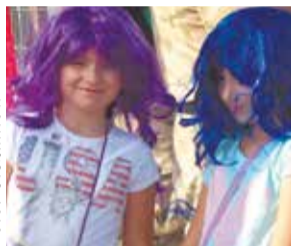
Fanki motoryzacji czy disco?

Późnym popołudniem rozpoczęły się występy gwiazd disco polo. Przed licznie zgromadzoną publicznością z całego