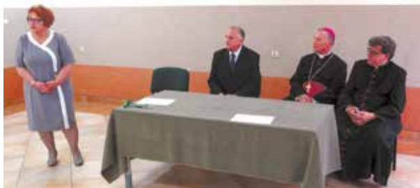
Dyrekcja szkoły i znamienici goście

- Oto dzisiaj znajdujemy się w nowej rzeczywistości oświatowej, w Branżowej Szkole I Stopnia im. kpt. Stefana Pogonowskiego, która z dniem 1 września 2017 roku powoła-