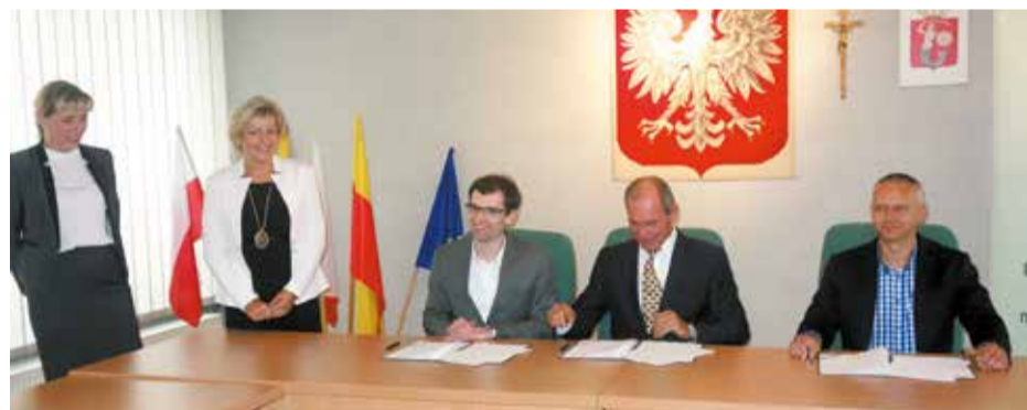
Podczas podpisywania umowy

LI Liceum Ogólnokształcące przy ulicy Kadrowej wzbogaci się o piękne boisko sportowe.