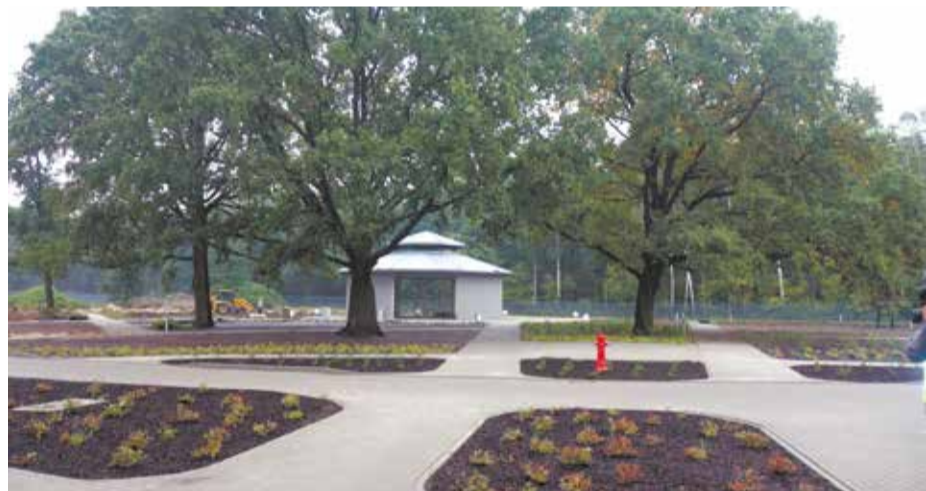
Wokół szpitalnego budynku będzie dużo zieleni oraz miejsce na grilla

segmentów, połączonych tzw. strefą wielofunkcyjną, przypominającą ogród zimowy i prowadzącą do miejsc wypoczynku i terapii. W skład szpitala wchodzi m.in. centrum rehabilitacyjne oraz oddziały stacjonarne, w których dostępnych będzie w sumie 300 łóżek. Stworzona została także przestrzeń rekreacyjno-sportowa. Powstały alejki spacerowe, miejsce do gry w tenisa stołowego czy stanowisko do gry w szachy.