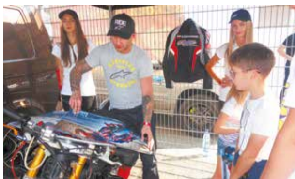
Można było zdobyć cenny autograf...