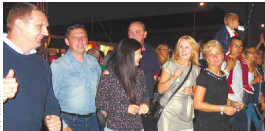
...bawią się przy rytmach disco