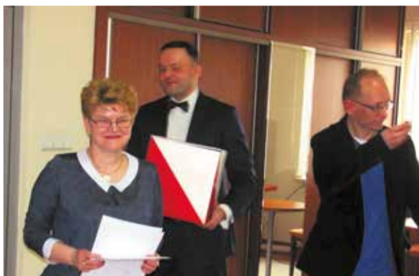
Członkowie komisji skrutacyjnej z urną

Tajemnicą poliszynela jest, że od jakiegoś czasu trwały przygotowania do przewrotu we władzach samorządu powiatowego. Na początek próbowano odwołać przewodniczącego rady, bo tutaj w głosowaniu wystarczy jeden głos przewagi. Z odwołaniem zarządu powiatu poszłoby już dużo trudniej. Ponieważ Klub PiS dysponuje w radzie powiatu 12 głosami, zaś koalicja radnych Wspólnoty Samorządowej, PO i Forum Dobrego Samorządu liczy 17 szablek i ma zdecydowaną przewagę, podjęto próby rozbicia tego monolitu. Skoro wniosek o odwołanie został złożony, to widać radni PiS uznali, że pozyskali sojuszników i mają większość w radzie. I trwali w tym przekonaniu aż do sesji, do ogłoszenia wyników głosowania, które pokazało, że żaden z koalicjantów nie dał się kupić stanowiskiem wicestarosty. Zawiązana po wyborach w 2014 r. koalicja trzyma się jak skała i pewnie z powodzeniem dotrwa do końca kadencji. Red.