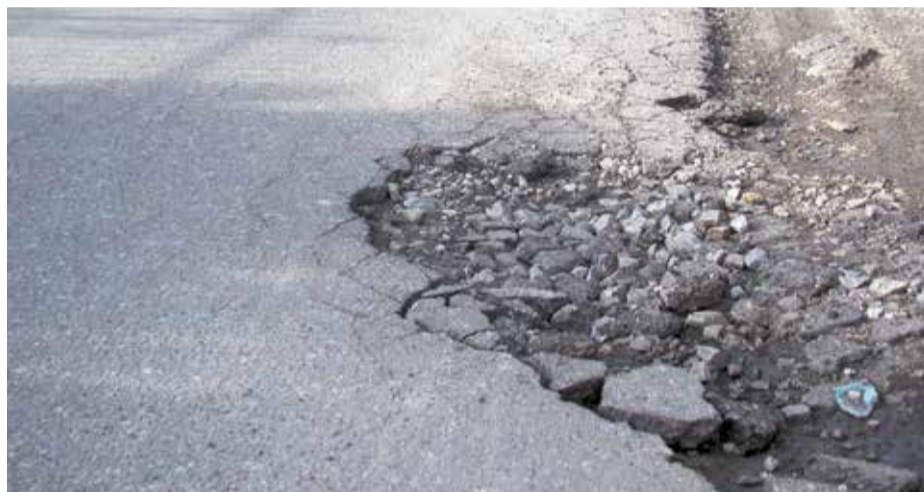
Asfalt na ul. Ciasnej został zniszczony przez koparki i ciężarówkę, które absolutnie nie powinny tędy jeździć

interesu mieszkańców, którzy mają zdewastowaną drogę, w dodatku niebezpieczną, bo w tej dziurze można skrócić nogę. Dlatego dobrze byłoby, gdyby pozimowe naprawy wyszły poza centrum Wołomina. Dwa tygodnie temu pisaliśmy także o przystanku na al. Niepodległości, z którego został tylko dach. Tutaj nic się nie zmieniło, wiatra nadal nie została naprawiona. O wiosennych porządkach pisać nie będziemy, bo trudno pisać o czymś czego nie ma.