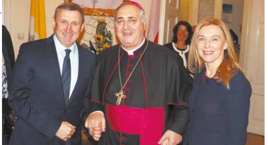
Ambasador Ukrainy w Polsce Andrij Deszczycia z małżonką i Nuncjuszem Apostolskim w Polsce Arcybiskup Salvatore Pennacchio