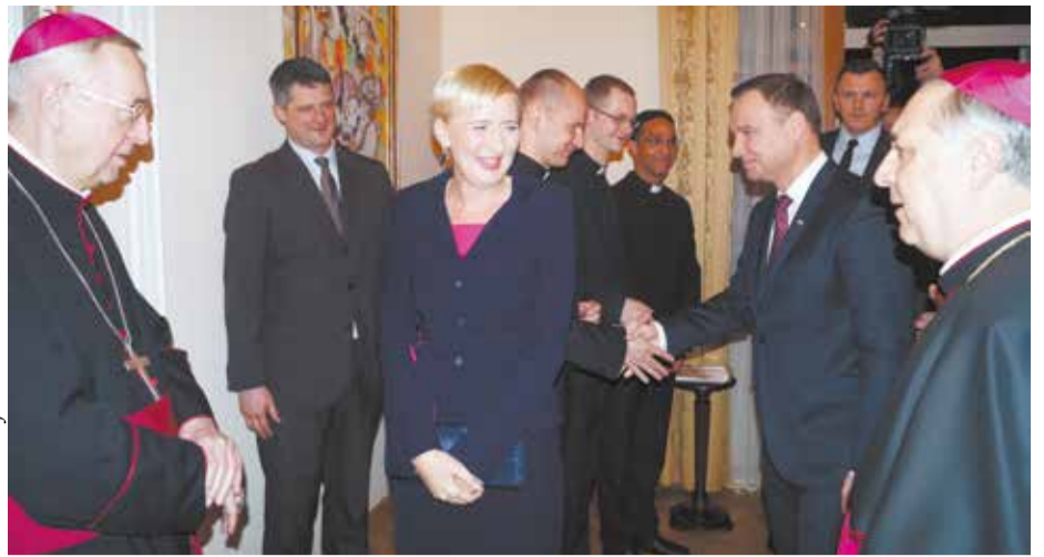
Prezydent RP Andrzej Duda z małżonką witany przez Nuncjusza Apostolskiego w Polsce arcybiskupa Salvatore Pennacchio podczas uroczystości 4. rocznicy pontyfikatu Ojca Świętego Franciszka