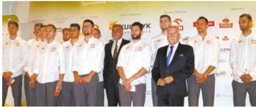
Reprezentacja olimpijska siatkarki oraz działacze