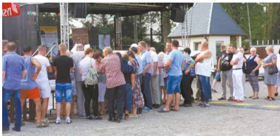
W kolejce po flaczki utworzyła się długa kolejka - jak za PRL-u