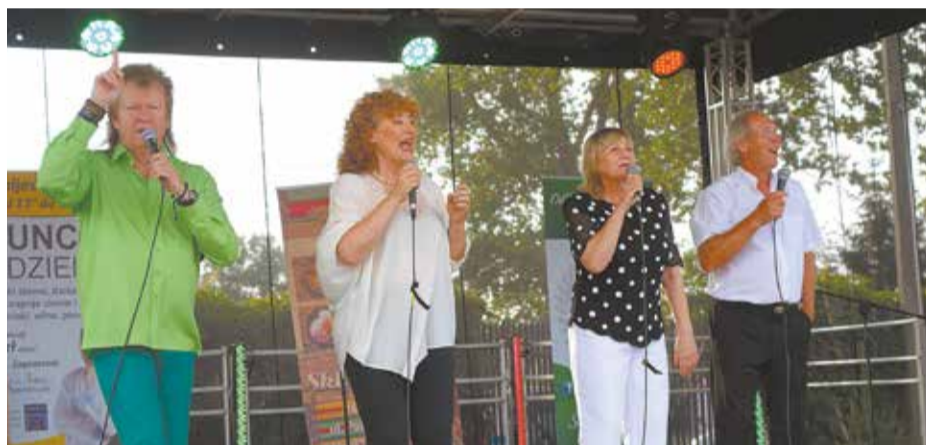
Na scenie zespół Partita