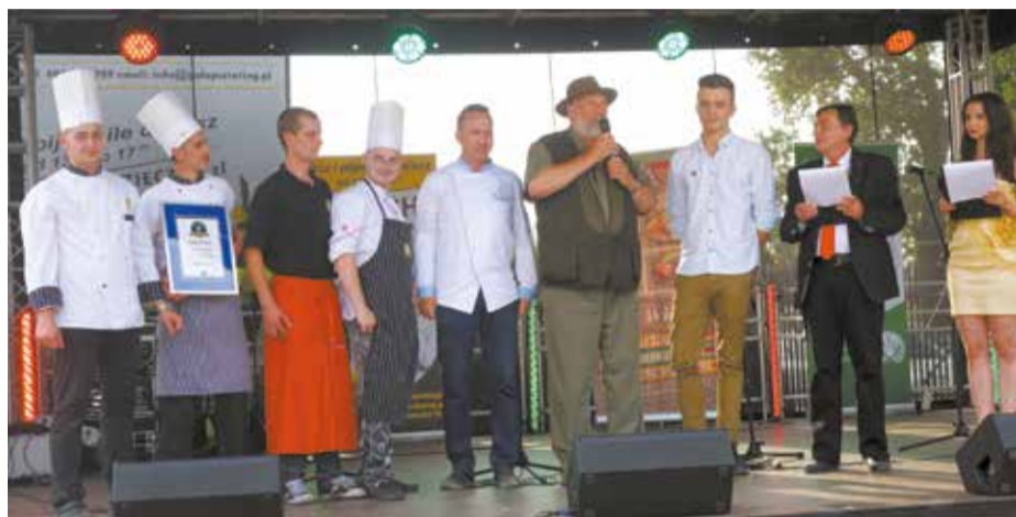
Kolejny sukces kucharzy Galopu: mistrzostwo Polski i rekord Guinnessa w gotowaniu flaków po warszawsku