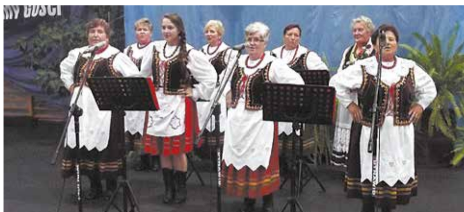
Zespół „Kalinki” KGW Mięse

Po nabożeństwie barwny korowód z zespołami przeszedł do hali Gminnego Centrum Sportu i Rekreacji w Wąsewie. Tam przez kilkanaście godzin