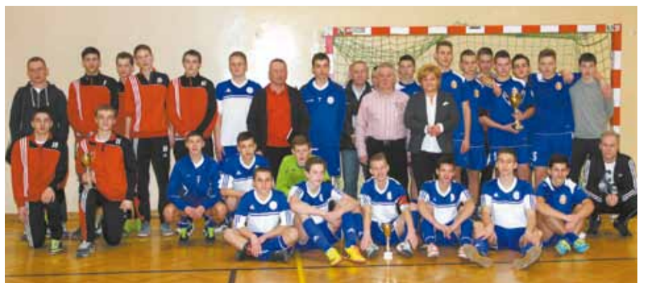
Pamiątkowe zdjęcie 4 najlepszych drużyn z gośćmi honorowymi turnieju